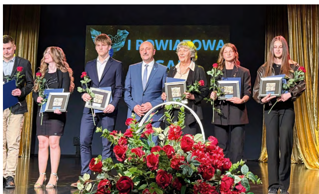
Sportowcy z gminy Nowiny znaleźli się w gronie wyróżnionych podczas I Powiatowej Gali Sportu, która odbyła się w Wojewódzkim Domu Kultury w Kielcach