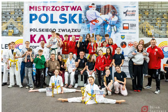
Zawodnicy Klubu Karate Kyokushin „Chikara” wywalczyli aż 15 medali podczas Mistrzostw Polski w Opolu, potwierdzając wysoką formę i skuteczność treningów

Klub Karate Kyokushin „Chikara” wystawił 29 najlepszych zawodników startujących zarówno w konkurencji kata (układ technik), jak i kumite (walki). Ich wysiłek przełożył się na imponujący wynik – aż 15 zdobytych medali, które potwierdzają rosnącą siłę i konsekwencję szkoleniową klubu. Dzięki temu osiągnięciu klub znalazł się na 2 miejscu w klasyfikacji zdobytych medali z całej Polski.