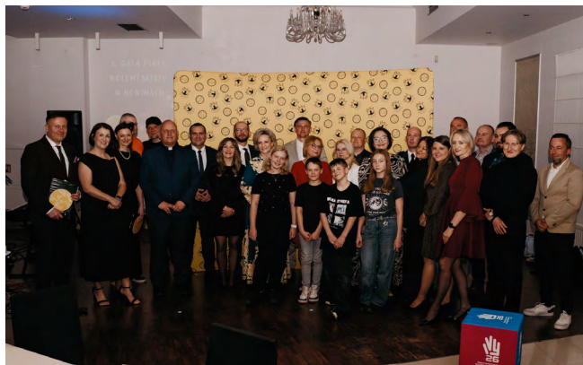
Osoby i instytucje wspierające rozwój wolontariatu w gminie Nowiny zostały docenione za zaangażowanie i pomoc w realizacji licznych inicjatyw społecznych

– Jubileuszowa Gala Wolontariatu to wyjątkowy moment, w którym możemy zatrzymać się i docenić tych, którzy na co dzień działają z potrzeby serca. Ponad trzy tysiące przepracowanych godzin to nie tylko liczby, ale konkretne historie pomocy, wsparcia i zaangażowania. Jestem dumny, że w naszej gminie tak wielu młodych i dorosłych mieszkańców chce działać na rzecz innych. To pokazuje, że mamy ogromny potencjał i wrażliwość społeczną, którą warto pielęgnować