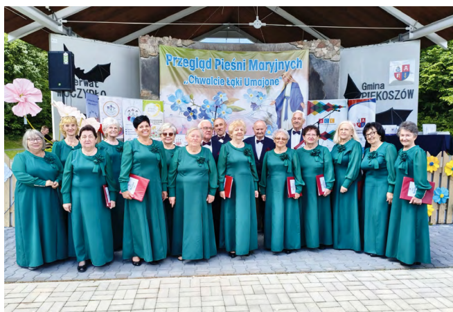
Chór „Nowina” wzruszył publiczność podczas przeglądów Pieśni Maryjnych, zdobywając także II miejsce w konkursie w Jaworzni

IV Przeglądu Pieśni Maryjnych „Chwalcie Łąki Umajone” w Jaworzni. Artyści nie tylko wzruszyli publiczność swoim repertuarem, ale także odnieśli duży sukces, zdobywając II miejsce w konkursie w Jaworzni. – Jestem niezwykle dumny z mieszkańców naszej gminy, którzy z taką pasją i zaangażowaniem promują lokalną kulturę, tradycję i kulinarne dziedzictwo. Dzięki działalności Kół Gospodyń Wiejskich oraz naszych artystów tradycje są wciąż żywe i spotykają się z uznaniem wszędzie