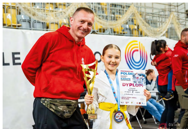
Reprezentanci „Chikary” pokazali ogromną determinację i sportowy charakter podczas rywalizacji z najlepszymi zawodnikami z całej Polski