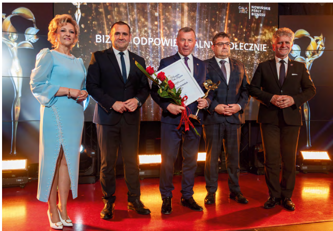
W kategorii Biznes Odpowiedzialny Społecznie zwyciężyły Wodociągi Kieleckie Sp. z o.o.