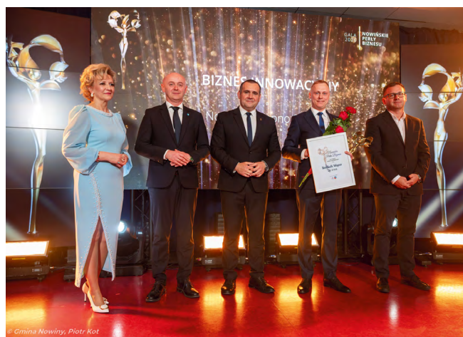
W kategorii Biznes Innowacyjny zwyciężyła firma Nordkalk Wapno Sp. z o.o.