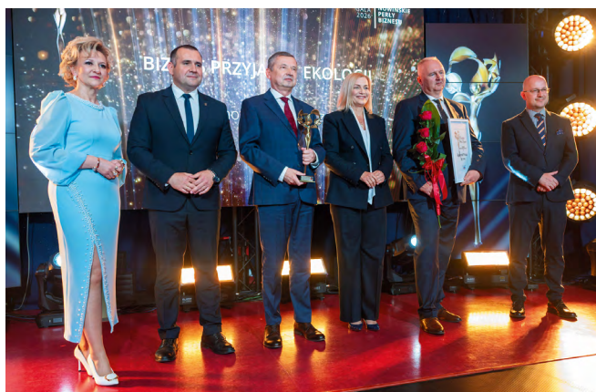
W kategorii Biznes Przyjazny Ekologii statuetkę zdobyła firma Dyckerhoff Polska Sp. z o.o.

Wodociągi Kieleckie Sp. z o.o., Dyckerhoff Polska Sp. z o.o., Nordkalk Wapno Sp. z o.o. oraz Truskawica S.A. zostały laureatami drugiej edycji Gali „Nowińskie Perły Biznesu”, która odbyła się 13 maja w Gminnym Ośrodku Kultury „Perła” w Nowinach. Wydarzenie, połączone z Forum Biznesu i Przedsiębiorczości, ponownie zgromadziło przedstawicieli świata biznesu, samorządu i instytucji wspierających rozwój gospodarczy regionu. Był to wieczór pełen inspirujących rozmów, prestiżowych wyróżnień i podkreślenia ogromnej roli przedsiębiorców w rozwoju gminy Nowiny.