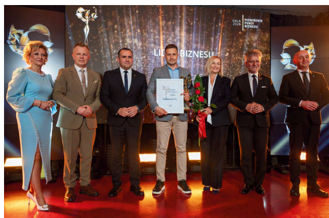
Tytuł Lidera Biznesu zdobyła firma Truskawica S.A