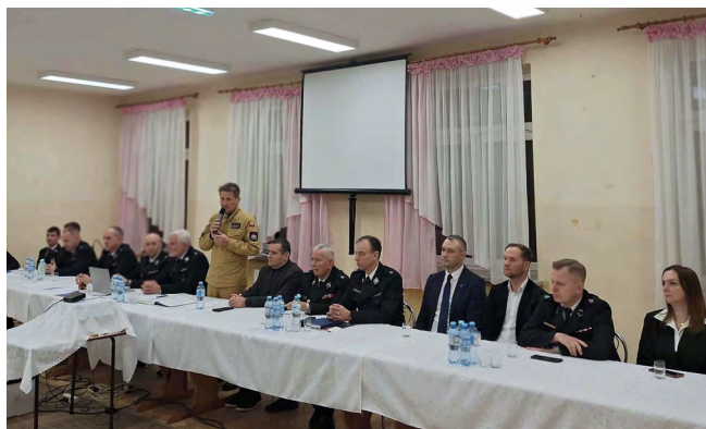
Zebranie sprawozdawczo-wyborcze w OSP Kowala