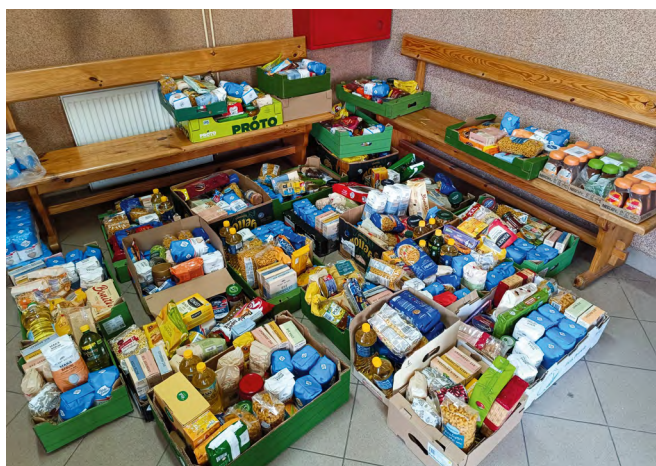
340 kilogramów zebranej żywności to efekt zaangażowania mieszkańców i pracy wolontariuszy podczas Wielkanocnej Zbiórki Żywności w Nowinach

W Nowinach zakończyła się Wielkanocna Zbiórka Żywności, która po raz kolejny pokazała, jak dużą siłę ma lokalna solidarność. Dzięki zaangażowaniu mieszkańców i pracy wolontariuszy udało się zebrać aż 340,90 kg produktów spożywczych, które jeszcze przed świętami trafiły do osób najbardziej potrzebujących.