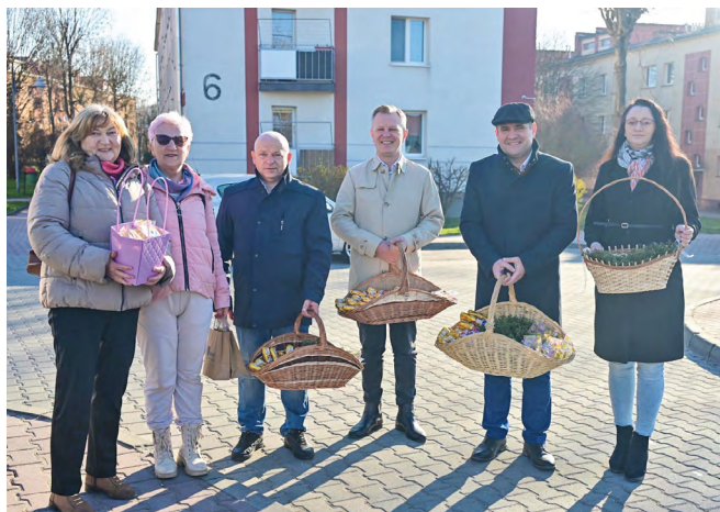
Wielkopiątkowe spotkania samorządowców z mieszkańcami to czas rozmów, życzeń i drobnych upominków, które wprowadzają w świąteczny nastrój

nie tylko o nadchodzących świętach, ale również o codziennych sprawach ważnych dla mieszkańców.