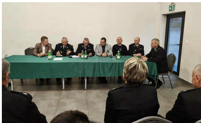
Zebranie sprawozdawczo-wyborcze w OSP Szewce-Zawada

Dziękujemy wszystkim strażakom OSP za dotychczasową służbę, zaangażowanie oraz gotowość do działania na rzecz bezpieczeństwa mieszkańców Gminy Nowiny życząc dużo zdrowia, spokojnej służby, szczęśliwych powrotów z każdej akcji i opieki Św. Floriana. Gratulujemy nowo wybranym Zarządom i życzymy powodzenia w budowaniu przyszłości jednostki.