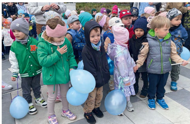
Niebieski marsz przeszedł ulicami Nowin, jednocząc dzieci, młodzież i mieszkańców we wspólnym geście wsparcia dla osób w spektrum autyzmu

Uczestnicy wydarzenia, ubrani w niebieskie barwy, przeszli wspólnie przez miejscowość, niosąc balony i symbole wsparcia. W marszu wzięły udział dzieci z Przedszkola Samorządowego im. Pluszowego Misia w Nowinach, a także przedstawiciele innych placówek oświatowych z terenu gminy oraz Niepubliczne Przedszkole specjalne dla dzieci z autyzmem „Słowicza Ferajna”, z którym lokalne instytucje od lat współpracują.