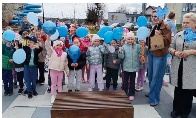
Uczestnicy marszu, ubrani w niebieskie barwy i niosący balony, pokazali, jak ważne są akceptacja, empatia i solidarność

W Nowinach po raz kolejny wybrzmiał ważny głos wsparcia i akceptacji. W ramach Światowego Miesiąca Świadomości Autyzmu ulicami gminy przeszedł III Marsz dla Autyzmu, który zgromadził przedszkolaków, uczniów, nauczycieli oraz mieszkańców i samorządowców chcących okazać solidarność z osobami w spektrum.