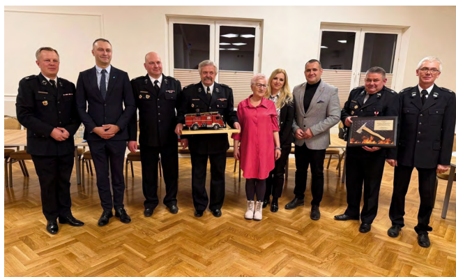
Zebranie sprawozdawczo-wyborcze w OSP Wola Murowana

W dniu 21 marca 2026 r. odbyło się Walne Zebranie Członków OSP Szewce, spotkanie miało charakter sprawozdawczo-wyborczy związane ze skróceniem kadencji Zarządu tej jednostki, spowodowane planowanym włączeniem się w kalendarz wyborczy Związku Ochotniczych Straży Pożarnych RP. Podczas spotkania wręczone zostały medale zasłużonym druhom i druhom OSP Szewce. Członkowie OSP Szewce jednogłośnie udzielili absolutorium ustępującemu Zarządowi oraz wybrali nowy Zarząd na kadencję 2026-2031: