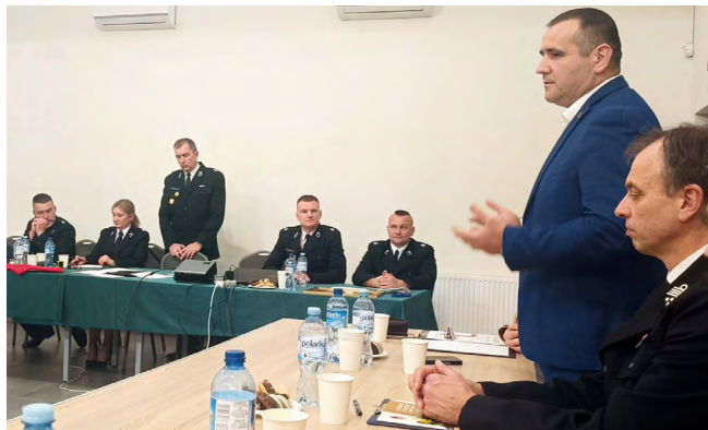
Zebranie sprawozdawczo-wyborcze w OSP Szewce

Ostatnie zebranie sprawozdawczo-wyborcze odbyło się 28 marca 2026r. jednostki OSP Szewce-Zawada. Podczas spotkania udzielono jednogłośnie absolutorium ustępującemu Zarządowi i dokonano wyboru nowego Zarządu, który ukonstytuował się w składzie: