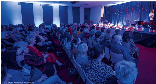
Sala koncertowa GOK „Perła” w Nowinach wypełniła się po brzegi gośćmi