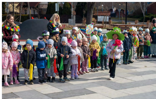
Przedszkolaki z Nowin w barwnych strojach powitały wiosnę na skwerze, wprowadzając wszystkich w radosny i pełen energii nastrój