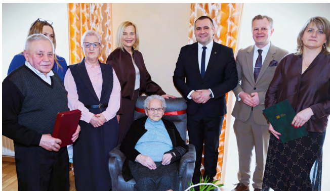
Jubilatka w otoczeniu zaproszonych gości i najbliższych podczas wyjątkowych obchodów setnych urodzin