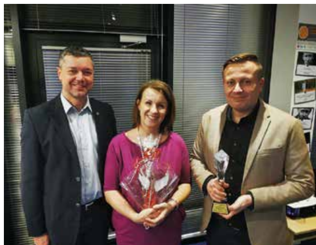
• Wójt przekazał szklanego anioła dla wolontariuszy.

Lokalne Centrum Wolontariatu w Nowinach to projekt realizowany z dotacji programu Aktywni Obywatele – Fundusz Krajowy finansowanego z Funduszy EOG.