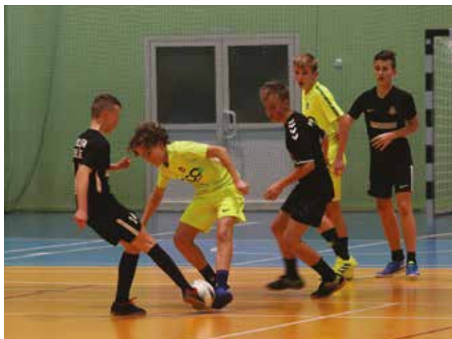
• Turniej mikołajkowy.

W mikołajki Liceum Sportowe w Nowinach zorganizowało halowy turniej dla chłopców którzy trenują w drużynach z najbliższej okolicy, a w przyszłym roku zakończą nauczanie w szkołach podstawowych. Mamy nadzieję, że wielu z nich weźmie udział w przyszłorocznej rekrutacji do naszej szkoły. Drużynom dziękujemy za przybycie oraz sportową rywalizację zgodną z duchem fair play.