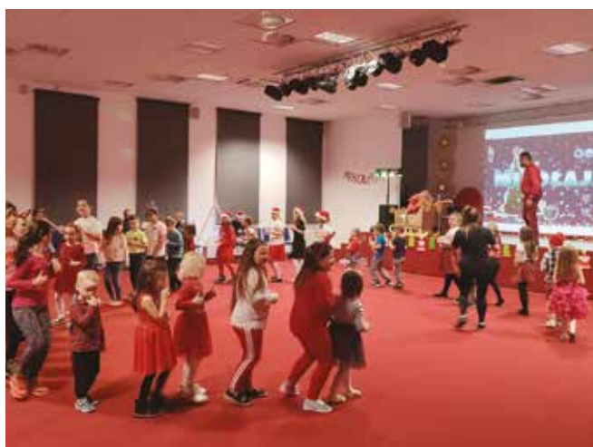
• Zabawa z Mikołajem.

Fantastyczna zabawa z animatorami - tańce, zabawy, konkursy, pokaz magicznych sztuczek, prezenty oraz wizyta najprawdziwszego Świętego Mikołaja! 6 grudnia w Gminnym Ośrodku Kultury Perła w Nowinach, na wszystkie grzeczne dzieci, czekała moc niespodzianek.