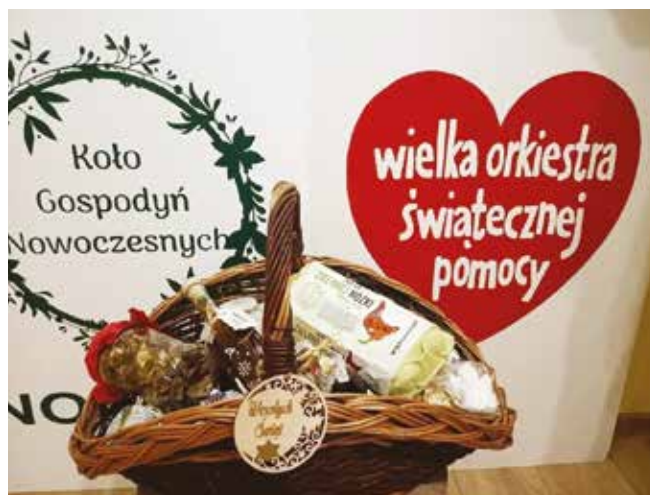
• Kosze z żywnością cieszą się ogromną popularnością.

– Wzrok to najważniejszy zmysł człowieka. Jakiegokolwiek problemy z nim związane wpływają na ogólny rozwój i poznawanie świata, dlatego tak istotne jest szybkie stwierdzenie ewentualnych nieprawidłowości i podjęcie leczenia, a czynnikiem niezbędnym do prawidłowej diagnozy i wdrożenia terapii jest nowoczesny sprzęt, którego polskim placówkom brakuje. Oddziały i pododdziały okulistyki dziecięcej oraz wydzielone łóżka dziecięce w oddziałach okulistyki dla dorosłych działają w 25 ośrodkach w 17 miastach Polski. W całym kraju są też poradnie okulistyki dziecięcej, które również wymagają wyposażenia w nowoczesny sprzęt okulistyczny. Rokrocznie na oddziałach okulistyki dziecięcej hospitalizowanych jest kilkanaście tysięcy pacjentów. Jednymi z najczęstszych powodów, dla których dzieci trafiają do specjalistów z zakresu okulistyki, są – poza pogorszeniem ostrości wzroku – jaskra, zaćma, różnego rodzaju urazy, anomalie rozwojowe i nowotwory. Wiele tych schorzeń wymaga wykonania zabiegów operacyjnych – w 2019 roku przeprowadzono ich blisko 650, z czego najwięcej, ponad 25%, stanowiły operacje guzów. Specjaliści uwagę zwracają również na krótkowzroczność wśród dzieci i młodzieży, która w coraz większej liczbie krajów przybiera charakter epidemiczny, co ma bezpośredni związek z nadmiernym korzystaniem z urządzeń elektronicznych – czytamy w informacji prasowej Biura prasowego Fundacji WOŚP.