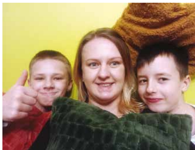
• Poduszka dla staruszka.

Pomóż nam! Wesprzyj akcję finansowo bądź materialnie, zrób zdjęcie z poduszczką, wrzuc na swój profil ze skopiowaną treścią posta i NOMINUJ kolejne osoby/instytucje. Im więcej poduszek - tym więcej uśmiechniętych twarzy samotnych seniorów. •