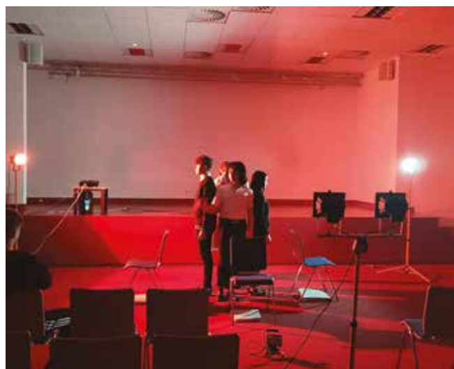
• Po drugiej stronie lustra.

Odbiorcami spektaklu była młodzież z nowińskich szkół podstawowych i liceum sportowego. Po spektaklu rozmawiali oni z aktorami na temat odbioru sztuki i codziennych problemów.