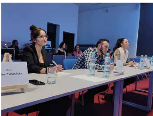
• Jury konkursu.