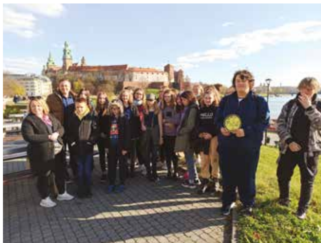
• Wizyta studyjna w Krakowie.

Szkole Podstawowej nr 34 w Radomiu. Następnie mieliśmy spotkanie w Klubokawiarni prowadzonej dla młodzieży. Odwiedziliśmy także Międzynarodowe Centrum Wolontariatu. Ostatnim punktem odwiedzin w instytucjach Centrum Młodzieży Arka był Klub dla dzieci i młodzieży.