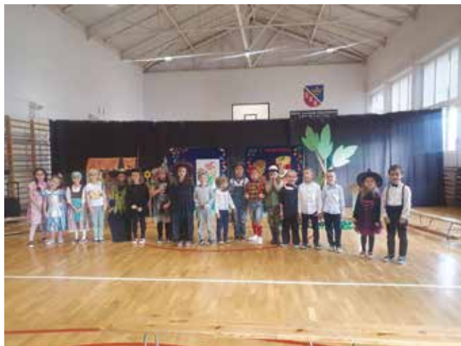
• Jaś i Małgosia.

Dnia 24.11.2021 r. w naszym przedszkolu 6-latki występowały w spektaklu teatralnym pt. „Jaś i Małgosia”. Główni bohaterowie bajki postanowili zabrać wszystkich widzów do tajemniczego lasu, w którym kryła się chatka z pierników i jej przebiegła właścicielka z koleżankami. Jaś i Małgosia przez swoją nie-