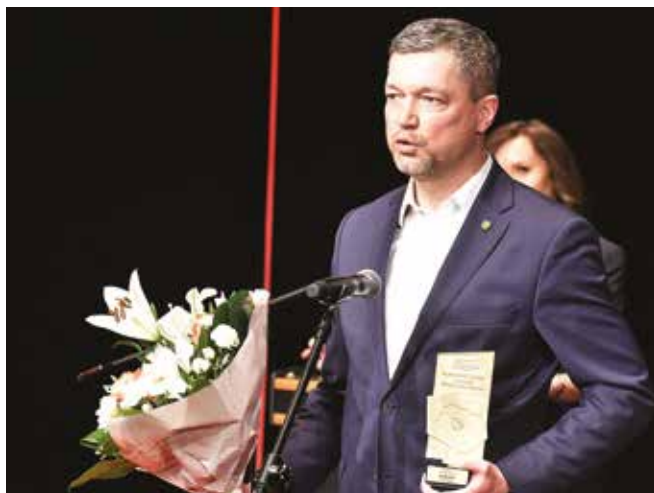
• Tuż po odebraniu nagrody.

Celem Rankingu Gmin Regionu Świętokrzyskiego było wyłonienie i promowanie gmin wyróżniających się pod względem rozwoju społeczno-gospodarczego oraz najlepszych praktyk przez nie stosowanych. W ramach Rankingu ocenie poddawane są wszystkie gminy Województwa Świętokrzyskiego z wyłączeniem miast na prawach powiatu. Za zebranie i zestawienie wyników odpowiada Urząd Statystyczny.