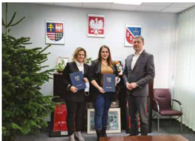
• Awans zawodowy nauczycieli.

W siedzibie Urzędu Gminy Nowiny odbyło się uroczyste wręczenie aktów nadania stopnia awansu zawodowego nauczyciela mianowanego.