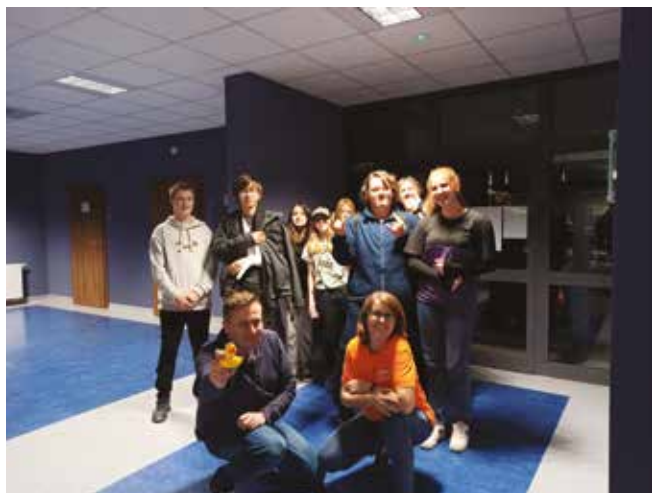
• Szkolenie LCW.

Za nami pierwsze szkolenia tematyczne dla naszych wolontariuszy. Tematyka szkoleń została wybrana przez samych wolontariuszy. Jako pierwsze na tapetę poszło szkolenie z kreatywnego fundraisingu. Trenowaliśmy naszą kreatywność - za pomocą konkretnych gier i zadań stworzyliśmy nowe, innowacyjne pomysły. Na zajęciach gimnastykowaliśmy nasze umysły poprzez aktywną zabawę, aby sprawdzić jak wiele sami jesteśmy w stanie wymyślić. Poznaliśmy również nowe metody i sposoby działania w promowaniu wolontariatu (np. z wykorzystaniem internetu). To były bardzo aktywne dwa dni. Przed nami kolejne szkolenie z pedagogiki cyrku, które obejmować będzie historię i założenia pedagogiki cyrku, czyli skąd, jak, dlaczego i po co nam umiejętności sztuki cyrkowej. Na nas samych poznamy terapeutyczne właściwości śmiechu. Nauczymy się różnych trików i sztuczek. Będziemy gimnastykować się z kręceniem talerzami, żonglerką chustkami, modelowaniem zwierzątek z balonów i... Owocem szkolenia będzie zdobycie umiejętności cyrkowych, które można wykorzystać przy organizacji eventów, zabaw i warsztatów dla młodszych i starszych.