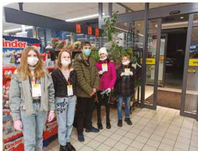
• Zbiórka żywności.

ma na celu zbiórkę nowych poduszek-jaśków dla podopiecznych Domów Pomocy Społecznej i hospicjów w regionie świętokrzyskim. Wolontariusze zachęcają do przekazania nowej poduszki ze sztucznym wypełnieniem przeznaczonej dla dorosłych. Miejsca zbiórek to min.: GOK w Nowinach, MOPR Wolontariat Kielce i Katolicka Szkoła Podstawowa im. Maryi z Nazaretu w Kielcach, Gmina Nowiny, Zespół Szkół Ponadpodstawowych w Nowinach. Akcję można także wesprzeć symboliczną kwotą na zakup jaśka na: pomagam.pl/poduszka . Za zebrane pieniądze zostaną zakupione poduszki i przekazane do potrzebujących placówek. Akcja trwa do końca 2021 roku. Stoisko naszego LCW, na którym będzie można także przynieść poduszkę będzie podczas Jarmarku Bożonarodzeniowego w Nowinach.