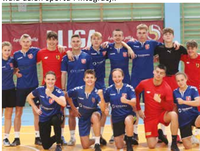
• Dzień sportu.

W poniedziałek 6 grudnia, nasza szkoła zorganizowała dzień sportu i integracji.