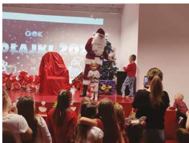
• Zabawa z Mikołajem.