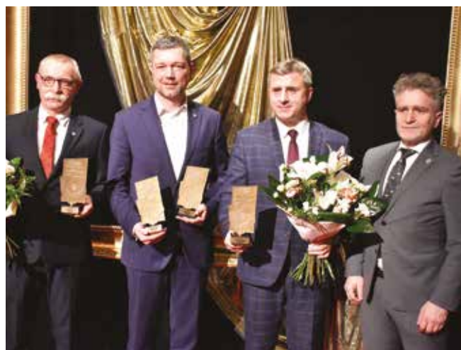
• W gronie zwycięzców.

czeniu na jednego mieszkańca, wydatki majątkowe w przeliczeniu na jednego mieszkańca, wskaźnik zadłużenia, liczba podmiotów gospodarczych, wyniki egzaminów ósmoklasistów, poziom dofinansowania unijnego, saldo migracji, skanalizowanie gminy czy też wydatki bieżące na oświatę i wychowanie. Tak zróżnicowane kryteria mają zapewnić jak najwyższy poziom obiektywizmu, by wskazać, które gminy najlepiej realizują swoje zadania własne.