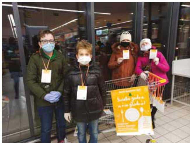
• Zbiórka żywności.

We współpracy z Kieleckim bankiem Żywności i Caritas Diecezji Kieleckiej odbyły się świąteczne zbiórki żywności w Biedronce w Nowinach. W organizację i przeprowadzenie zbiórek aktywnie włączyli się uczniowie i nauczyciele z Zespołu Placówek Oświatowych im. Pierwszej Kompanii Kadrowej w Bolechowicach i Szkoły Podstawowej im. Orłąt Lwowskich w Nowinach. Dzięki zbiórcze udało się zebrać prawie 200 kg żywności i przygotować ponad 20 paczek żywnościowych, które trafią do najbardziej potrzebujących rodzin i osób w naszej gminie. Dziękujemy wszystkim wolontariuszom i opiekunom za wsparcie tej ważnej inicjatywy.