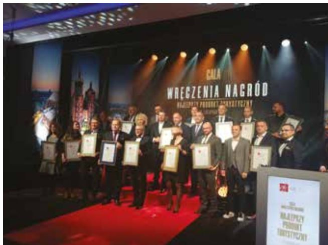
• Certyfikat POT dla Geoparku.

Geopark Świętokrzyski otrzymał w dniu 25 listopada na gali w Warszawie certyfikat Polskiej Organizacji Turystycznej w konkursie na Najlepszy Produkt Turystyczny w 2021 roku.