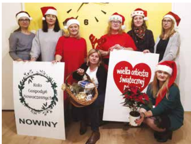
• Sztab WOŚP w Nowinach.

Stowarzyszenie Koło Gospodyń Nowoczesnych w Nowinach rozpoczęło przygotowania do 30. Finału Wielkiej Orkiestry Świątecznej Pomocy. Na facebook.com/wospnowiny już można licytować ciekawe fanty. Wystawione są: książki, kosmetyki, rękodzieło, vouchery, szybkowar, maskotki, poduszki, gry, zabawki, wyroby regionalne etc. Zachęcamy do licytowania i przekazywania darów na aukcje. Całkowity dochód zostanie przeznaczony na WOŚP. Finał odbędzie się 30 stycznia 2022 roku, a cel to zapewnienie najwyższych standardów diagnostyki i leczenia wzroku u dzieci.