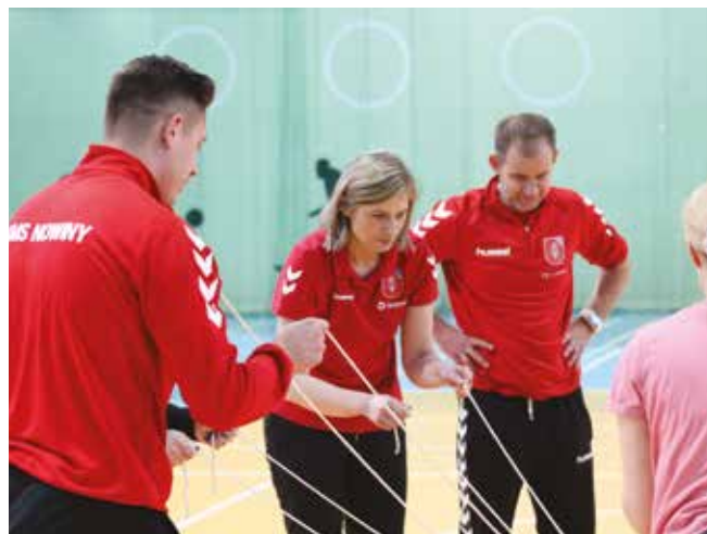
• Dzień sportu.

Atmosfera była świetna, uczniowie podeszli do konkursu z dużą dawką humoru oraz jak na sportowców przystało chęcią zwycięstwa.