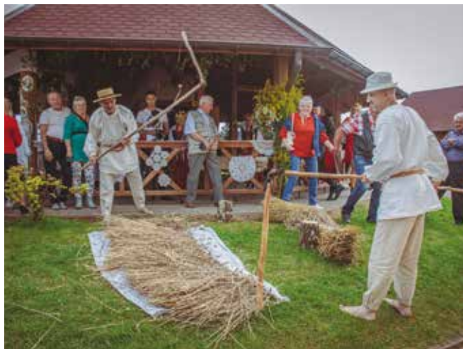
• Chleb - symbolika i rzeczywistość.

4. Chleb – symbolika i rzeczywistość – sztuka o pieczeniu chleba. Inicjatywa polegała na zorganizowaniu sztuki przedstawiającej dawne obrzędy i zwyczaje w związku z wypiekiem chleba na wsi. Kolejnym elementem inicjatywy był koncert karaoke – wspólne śpiewanie pieśni ludowych, przyśpiewek tradycyjnych. Degustacja potraw regionalnych przygotowanych przez Zespół Obrzędowy Kowalanki, a także konkurs dla dzieci związany z tematyką wydarzenia.