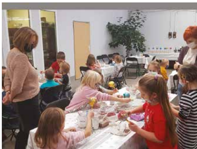
• W Fabryce Bombek.

26.11.2021 r. 5-6 latki z Przedszkola Samorządowego w Bolechowicach uczestniczyły w zwiedzaniu Fabryki Bombek w Staszowie. Dzieci szczegółowo zapoznaly się z produkcją bombek. Na własne oczy poznały kolejne etapy ich wytwarzania od wydmuchiwania ze szklanej rurki, przez srebrzenie, suszenie, aż po końcowy etap malowania i dekoracji.