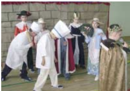
„Śpiąca królowna” – SP w Bolechowicach

Sześć teatrzyków szkolnych z gminy Sitkówka-Nowiny zaprezentowało się podczas V Prezentacji Teatrzyków Szkolnych, które w kwietniu odbyły się w Szkole Podstawowej w Kowali. Każda prezentacja była inna, każda wyjątkowa i wszystkie zasłużyły na najwyższe oceny – na szóstkę!