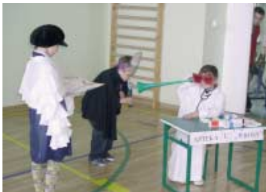
„O wróbelku Elemelku” – SP Kowala