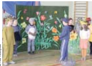
Widowisko ekologiczne – SP Nowiny