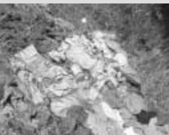
Śmieci zalegają w lasach i przy drogach. Te widoczne na zdjęciu ktoś wyrzucił obok ujęcia wody dla Nowin

Prawie 40% właścicieli posesji prywatnych na terenie gminy Sitkówka-Nowiny nie ma podpisanych umów z odbiorcą śmieci. Zaledwie co drugi z nich deklaruje, że w najbliższym czasie taką umowę podpisze. Tymczasem tereny zielone wokół dróg i lasy powoli zapełniają się śmieciami.