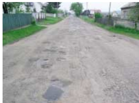
Bezdroże w Bolechowicach