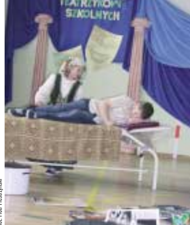
„Rodzina Cudnalińskich” – SP Kowala