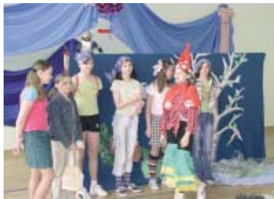
„Kłopoty leśnego krasnala” – SP Bolechowice