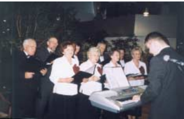
fol. Kamila PPK

Wielkie brawa zebrali członkowie chóru „Nowina” za występ na rozstrzygnięciu Rankingu Gmin Województwa Świętokrzyskiego. Chór „Nowina” został poproszony o uświetnienie swoim występem uroczystości, która 21 kwietnia odbyła się w Restauracji „Patio” Centrum Biznesu w Kielcach. Imprezie, która zebrała samorządowców z całego województwa patronowali Marszałek oraz Wojewoda Świętokrzyski.