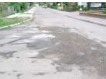
„Naprawiona” ul. Kubusia Puchatka w Zagrodach