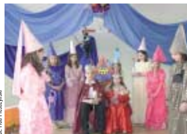
„Śpiąca królowna” – SP Sitkówka